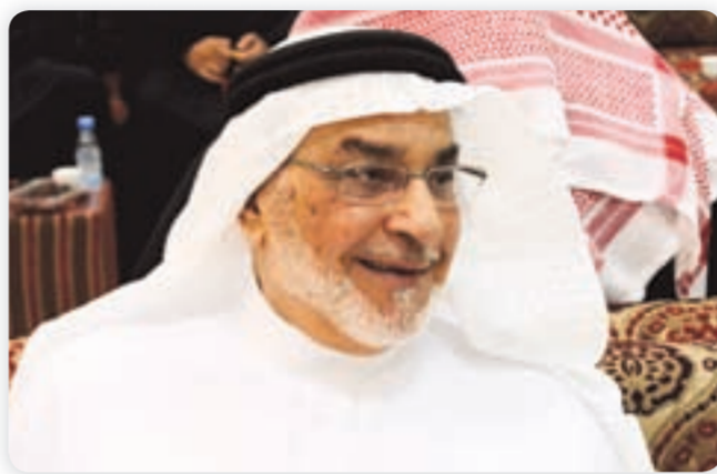
● عميد العائلة في السعودية