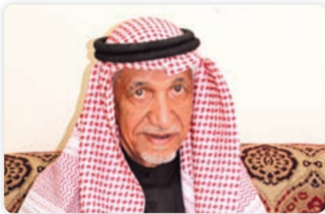
● عميد العائلة في الكويت