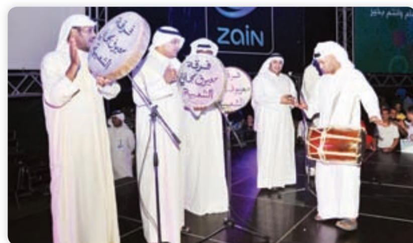
● فرقة معيوف مجلي الشعبية