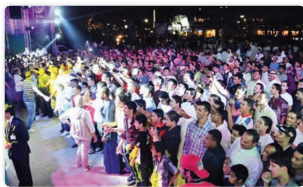
● حضور كثيف

جدير بالذكر ان هذا الاحتفال السنوي يأتي في اطار حرص «زين» ان ترسم الفرحة على وجه الحضور بالعديد من المفاجآت التي كانت في استقبالهم كل يوم من أيام العيد، فبخلاف المتعة والبهجة التي وجدها الجمهور الزائر في فعالياتنا للعيد حتى الآن وسيتمتع بالمزيد من الفقرات الترفيهية ومجموعة كبيرة من العروض الاخرى والمسابقات، التي ستشهد توزيع جوائز وهدايا قيمة».