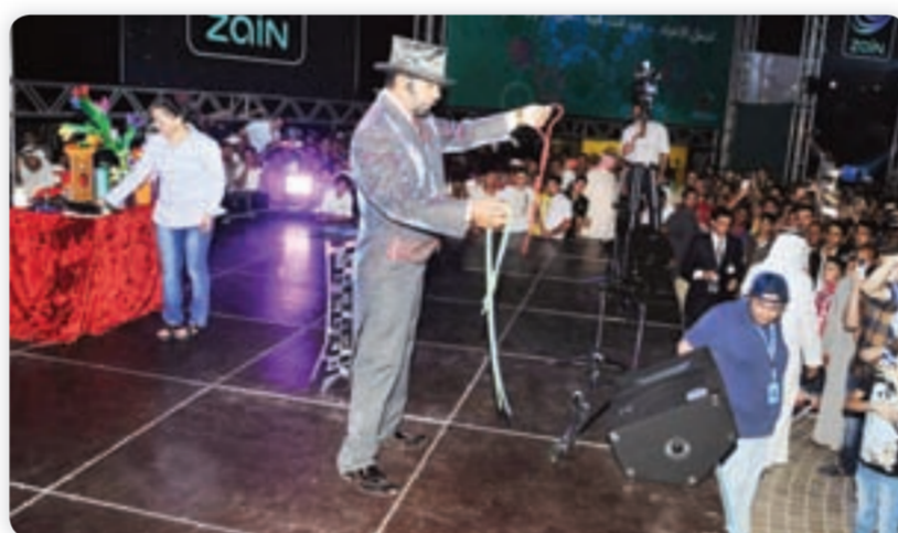
● تصوير: أحمد أبو عوية