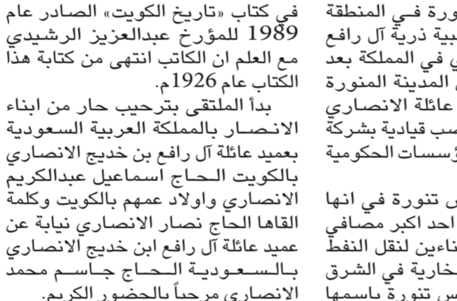
● عميد العائلة في الكويت