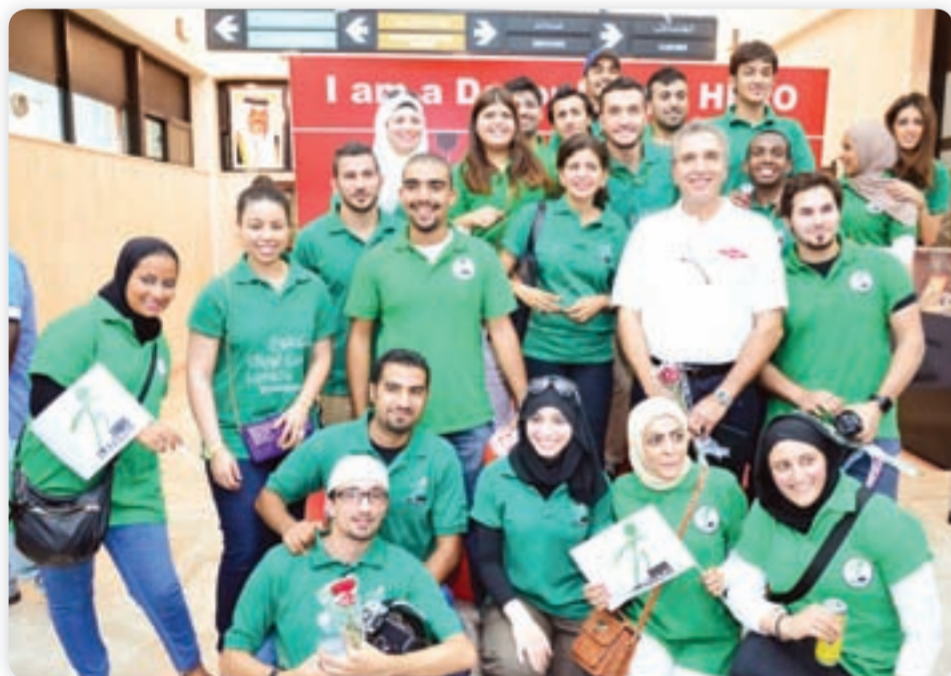
● لحظة جماعية

نادي الفينيكس. وكويت بايكرز اضافة الى طلبة لويك. بدأ اليوم بتجمع راكبي الدراجات المشاركين وطلبة «لويك»، وعددهم ما يقارب من 200 مشارك بمقر لويك ومن ثم الاتجاه الى بنك الدم عبر الدائري الاول للقيام بالتبرع بالدم هناك حيث يحملون شعار «نحن نشعر بقيمة الحياة بأهمية نقطة الدم». بعد اجراء الفحوصات اللازمة للمتبرعين تم التأكد من سلامة 165 متبرعاً قاموا جميعاً بالتبرع.